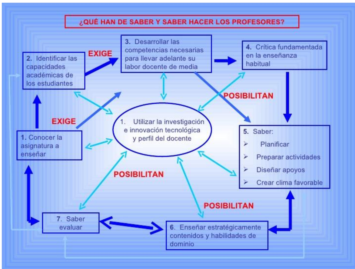
Figura 2. Saberes del profesor constructivista. Fuente: SLIDESHARE. NET 15

Por su parte, la institución constructivista debe garantizar los espacios y tiempos necesarios para que el estudiante se aproxime al conocimiento. Debe garantizar una experiencia mediada por las TIC, recursos bibliográficos, laboratorios y simuladores entre otros. Además, debe favorecer el desarrollo integral de la persona brindándole espacios artísticos, deportivos, lúdicos, de salud y académicos.